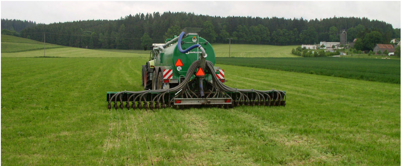
Verlustarme Gülleaufbringung mit einem Injektionsverfahren

Verordnung über die Anwendung von Düngemitteln, Bodenhilfsstoffen, Kultursubstraten und Pflanzenhilfsmitteln nach den Grundsätzen der guten fachlichen Praxis beim Düngen (Düngeverordnung–DüV) vom 26. Mai 2017, BGBl. I 2017, Nr. 32, S. 1305–1348