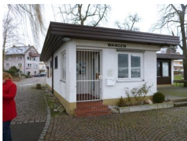
← Das Hafenmeisterbüro