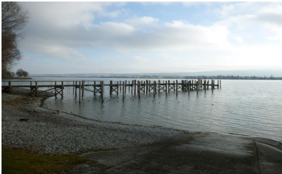
↑ Steg für die Abnahme