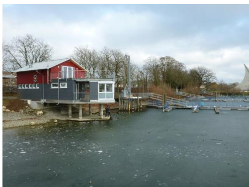
← Das Hafenmeisterbüro