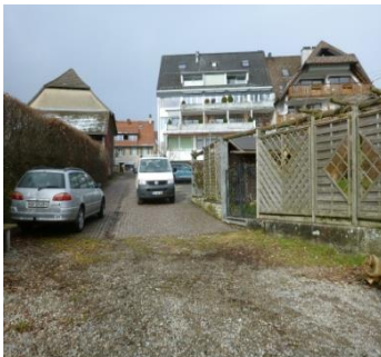
↑Naturslip und „Hafen“