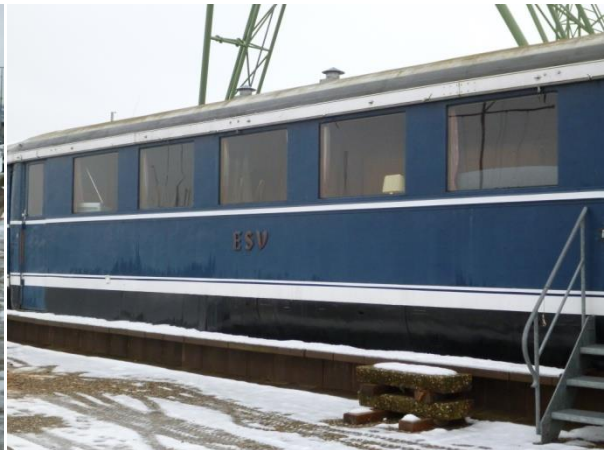
↑Sachverständiger wartet am blauen Enzian