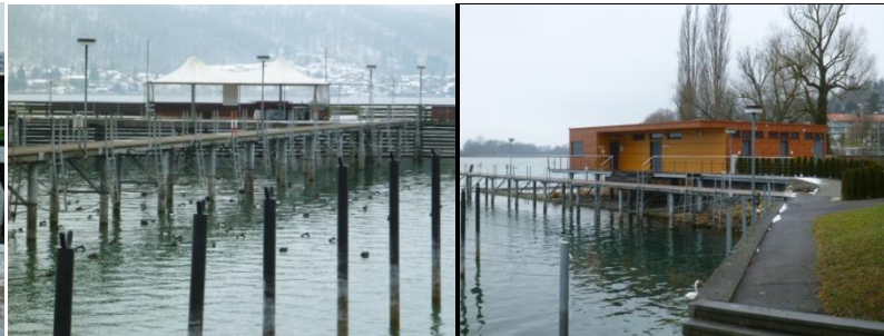
↑Möglichkeiten für den Aufenthalt des Sachverständigen↑