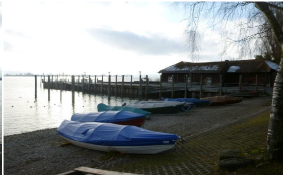
↑ Steg Fahrgastschiff