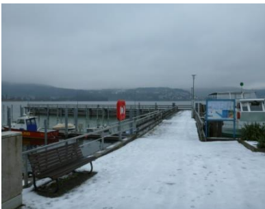
←Steg der Fahrgastschiffahrt