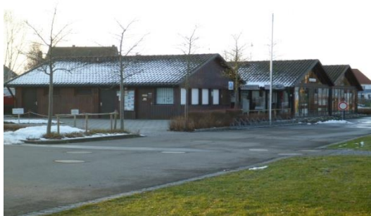
←Hafenmeisterbüro/ Segelschule Reichenau