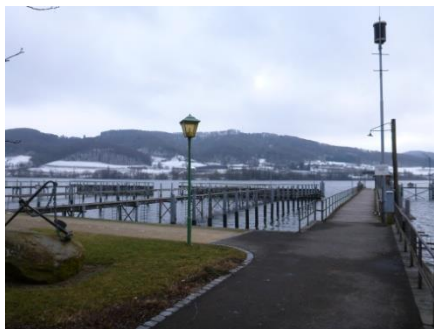
↑ Der Hafen