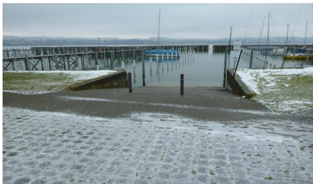
← Die Slipstelle