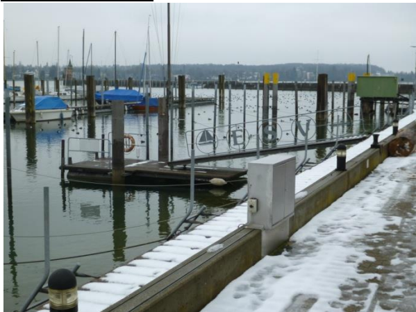
↑Steg des ESV (Hier ist die Abnahme)