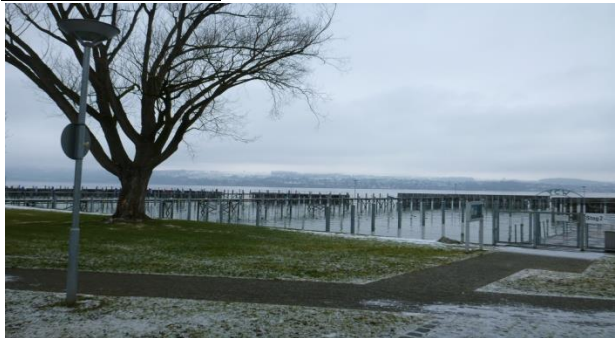
↑ Der Hafen