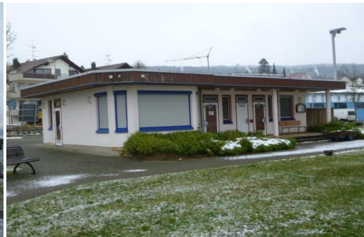
↑ Das Hafenmeisterbüro