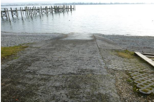
← Die Slipstelle