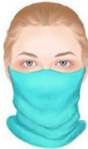
Schal / Halstuch

Sie müssen keine medizinische Schutzmaske tragen. Es genügt auch eine selbstgemachte oder gekaufte Stoffmaske, ein Tuch oder ein Schal um Mund und Nase.